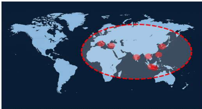
● 한국, 대만, 태국, 싱가포르, 말레이시아, 인도, 튀르키예, 이탈리아